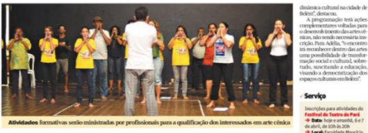
Atividades formativas serão ministradas por profissionais para a qualificação dos interessados em arte cênica

TEATRO Oficinas e palestras irão capacitar os estudantes e profissionais da área