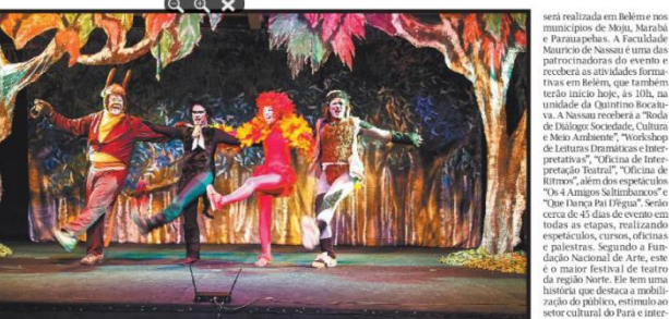
"Os 4 amigos saltilibancos" é uma live adaptação inspirada em conto dos irmãos Grimm

EM BELEM Musical "Os 4 amigos saltilibancos" aborda temáticas sociais no palco