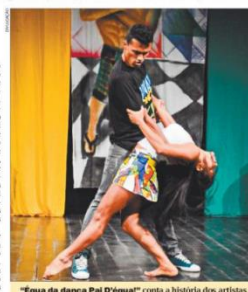
"Eggs of the Dance of Pal" conta a história dos artistas culturais paraenses, como os "Tribos do Ritmo". O trecho do espetáculo faz um apelo aos artistas do brega paraense, interpretados por

Montagem que será apresentada hoje faz homenagem aos autores e ritmos