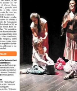
"Eggs of the Dance of Pal" conta a história dos artistas culturais paraenses, como os "Tribos do Ritmo". O trecho do espetáculo faz um apelo aos artistas do brega paraense, interpretados por

ATÉ DOMINGO No dia 24 deste mês, dentro da programação de hoje, às 19h, na Faculdade Maurício de Naxos, tem o musical "Os 4 Amigos Saltilibancos".