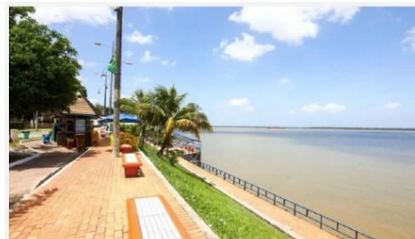
Projeto Conexão Brasil leva teatro, dança e música para Icoaraci