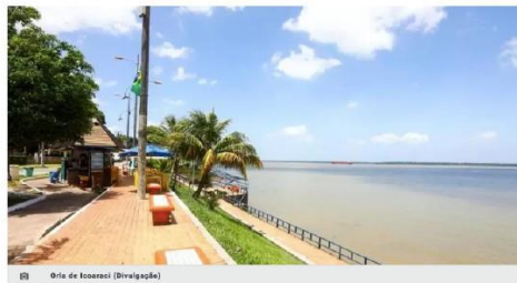
01 - Orla de Icoaraci