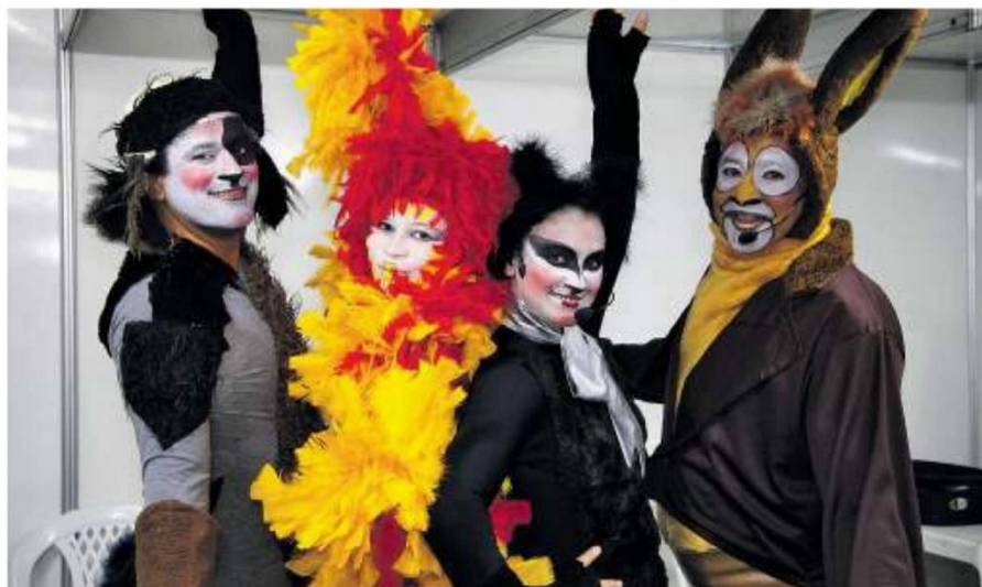
Contação de histórias e espetáculos infantis fazem parte do Dançarte, dividido entre a Praça de Eventos e o Centro Cultural de Parauapebas.