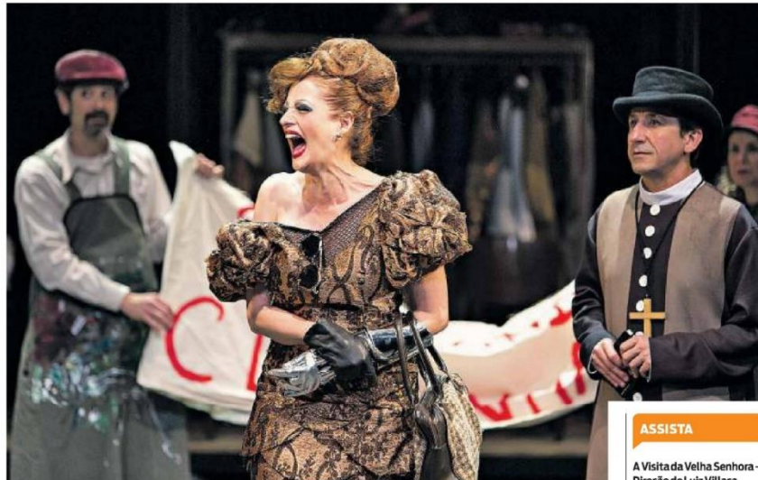
No texto de Friedrich Dürrenmatt, a milionária Claire faz uma proposta inusitada a uma cidade que espera ser salva da falência

O enredo aparentemente simples expõe a fragilidade dos valores morais e da nossa noção de justiça quando a palavra é dinheiro, em um desenrolar em que a protagonista é quase a encarnação mítica do poder matern-