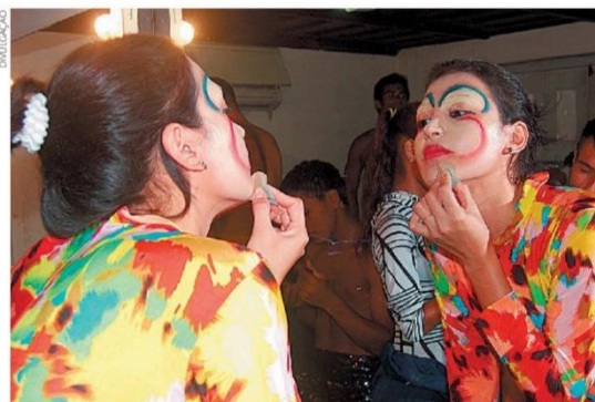
Participante do Dançarte preparando-se para entrar em cena

O evento, de quatro dias, está com uma programação bem diversificada. Espetáculos, cursos, oficinas, trocas de experiências, intercâmbios de companhias, são algumas das possibilidades do Dançarte 2011. A ideia é que durante as atividades os grupos, bailarinos, professores, pesquisadores, criadores, figurinistas, maquiadores e outros profissionais da capital e do interior de Estado, possam trocar conheci-