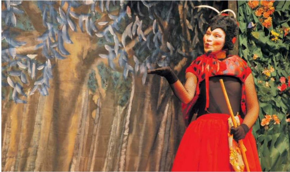
O Grupo de Contadores de Histórias do Pará apresenta contos infantis, como a Dona Baratinha, durante toda a semana. Abaixo, registro de uma das oficinas.

Até o próximo sábado, evento de artes cênicas leva intensa programação gratuita ao município