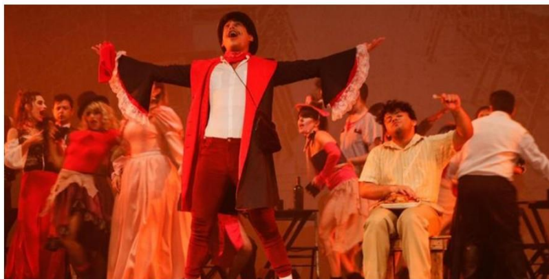
Apresentações do Dançarte iniciam neste final de semana em Belém

Programação será realizada também em outros três municípios até o mês de outubro